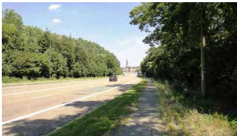
Zicht op de bestaande overgedimensioneerde Transcontinentaalbrug.