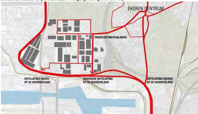
Bestaande situatie: Transcontinentaalbrug als gemengde ontsluiting met vrachtverkeer door Ekeren-Centrum.