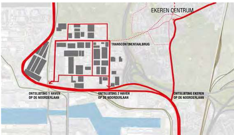
Ambitie: Transcontinentaalbrug gereduceerd tot woon-werk-verkeer functioneert als 2de toegang tot Bospolder.

Een nieuwe doorsteek door het Hagelkruispark via Schoonbroek en een vergroening van de straatprofielen tussen Hagelkruispark en de voetgangersbrug bieden de mogelijkheid dit deel van de groene figuur te vervolledigen.