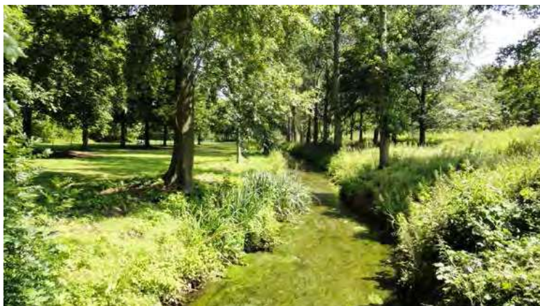
Bospolder als waardevolle recreatieve zone op wandelafstand van Ekeren-Centrum.