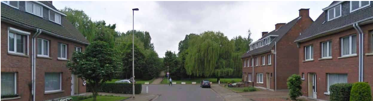
Bestaande situatie: Beperkt zichtbare voetgangersbrug over de A12.