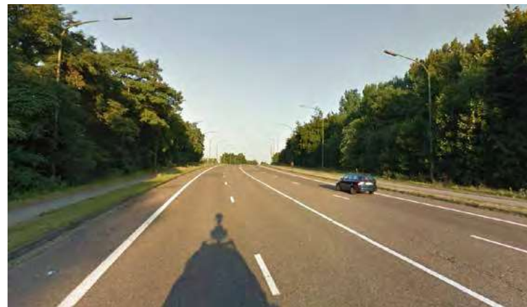
Zicht op de bestaande overgedimensioneerde Transcontinentaalbrug.