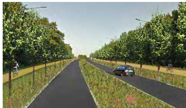
De Transcontinentaalweg als nieuwe groene verbinding met Bospolder.

De Transcontinentaalbrug en -weg zijn weinig functioneel in de ontsluiting van de havencluster Luithagen, tussen de Noorderlaan en de Bospolder. De havencluster kan voor vrachtverkeer worden ontsloten via twee toegangen op de Noorderlaan. Daardoor wordt doorgaand vrachtverkeer door het centrum van Ekeren vermeden en wordt de Transcontinentaalbrug beperkt tot woon-werkverkeer.