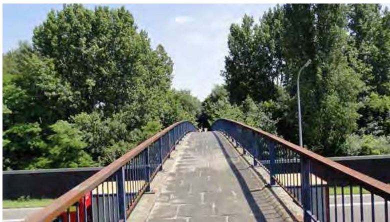
Passerelle, huidige verbinding tussen Ekeren-Centrum en Bospolder.